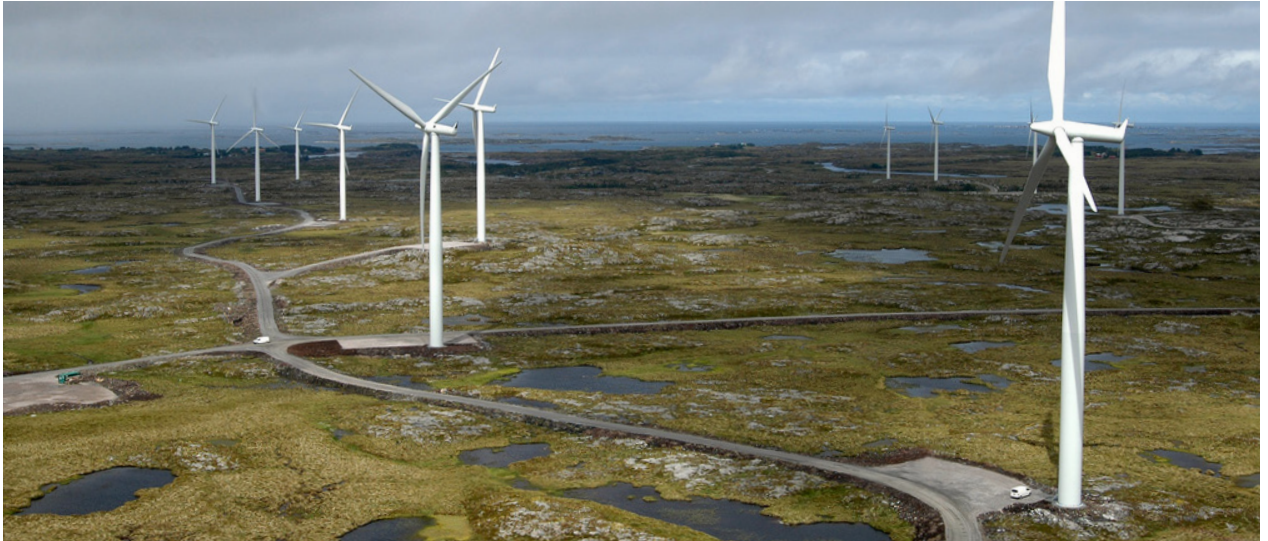
Smøla vindpark i Møre og Romsdal var Norges største vindkraftverk da det sto ferdig

Smøla vindpark ligger i Smøla kommune i Møre og Romsdal. Kraftverket består av 68 vindturbiner med en samlet kapasitet på 150 MW. Vindparken ligger i et flatt og åpent terreng, 10-40 meter over havet. Gjennomsnittlig årsproduksjon er 356 GWh, tilsvarende normalforbruket til 17 800 norske husstander.