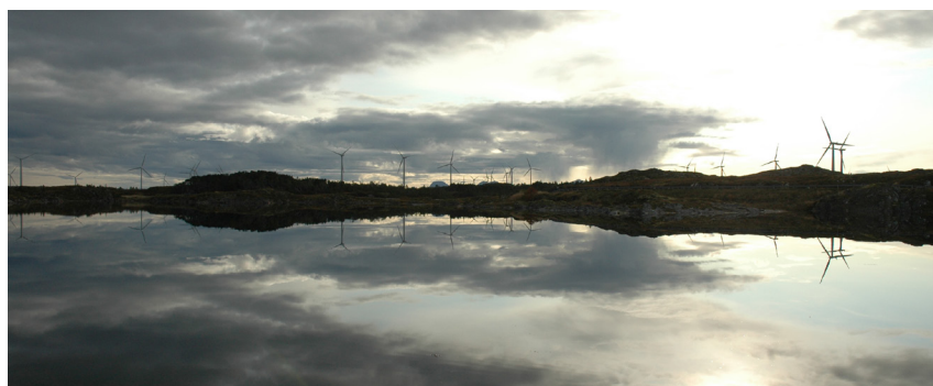
Vindparken sett fra nordsiden

Årlig dør i gjennomsnitt seks havørner som følge av kollisjoner med vindturbinene på Smøla. Havørnbestanden er imidlertid robust og har vært økende siden vindparken ble bygget. I 2009 ble det registrert aktivitet i 61 havørnterritorier på øya – den høyeste registrering noensinne. Bestanden ble da anslått til rundt 150 havørn og opp mot 10 000 på landsbasis. Fuglene hekker i liten grad inne i selve vindparken, men aktiviteten ellers på øya er høy. Statkraft har bidratt med betydelige forskningsmidler for å kartlegge havørnkollisjoner og forsøke å begrense problemet. Forskningsprogrammet ledes av Norsk institutt for naturforskning (NINA).