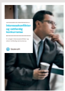
#4 Interessekonflikter og rettferdig konkurranse