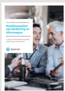
#7 Konfidensialitet og håndtering av informasjon