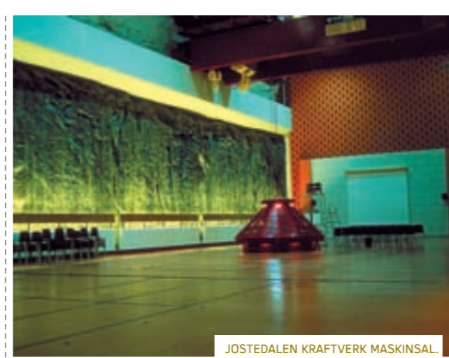
JOSTEDALEN KRAFTVERK MASKINSAL.

KARTGRUNNLAG: STATENS KARTVERK/TILLÆTSESNR. 2001/553