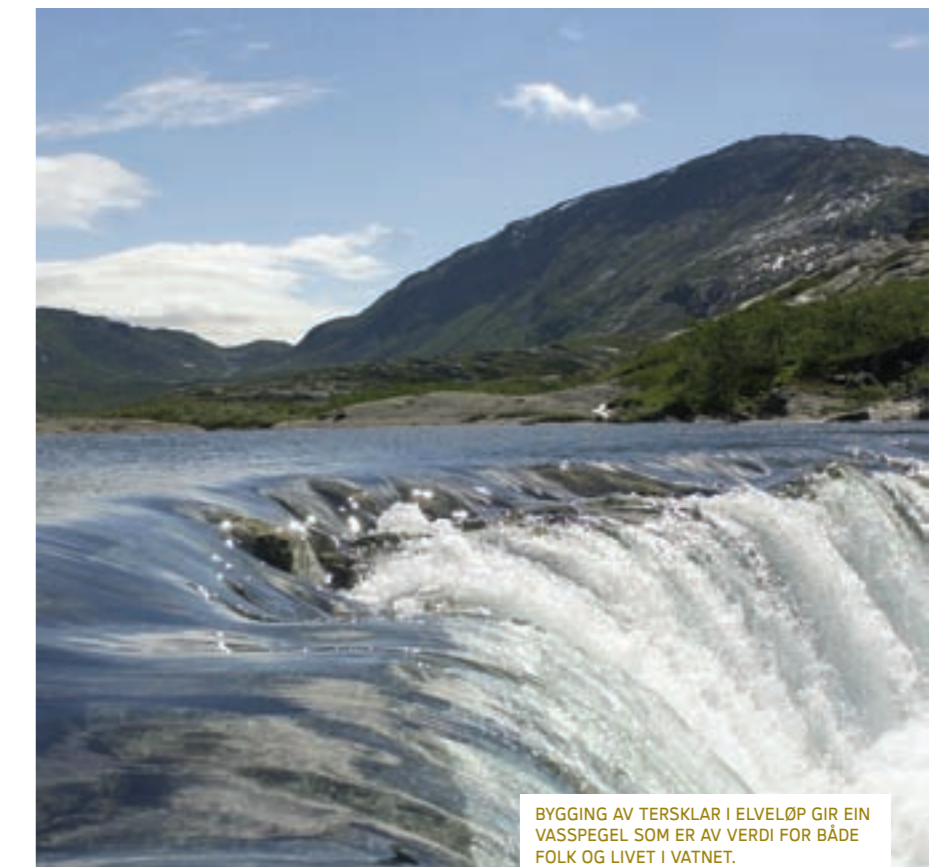
BYGGING AV TERSKLAR I ELVELØP GIR EIN VASSPEGL SOM ER AV VERDI FOR BÅDE FOLK OG LIVET I VATNET.

Det blir bygd tersklar, planta og sådd til i stort omfang. Der det er behov for det, ryddar vi opp etter tidlegare utbyggingar.